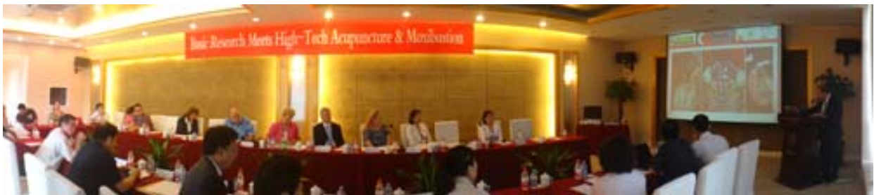
Med Uni Graz veranstaltete erstes „Transkontinentales High-Tech Akupunktursymposium“ in Peking.