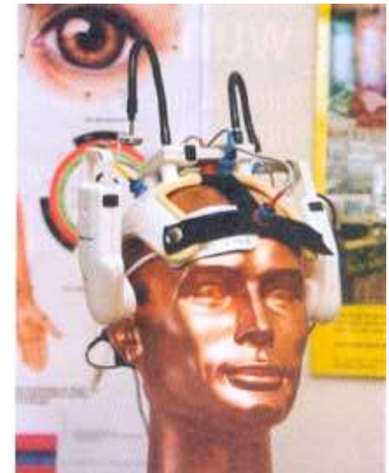
Multifunktionelle Helmkonstruktion zur Messung von Effekten der Akupunktur im Gehirn