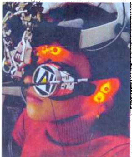
Computerkontrollierte Akupunktur im biomedizintechnischen Forschungslabor der Univ.-Klinik für Anästhesiologie und Intensivmedizin Graz